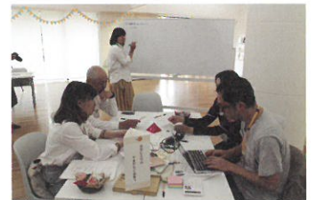
過去のつまむ会議の様子

2017年度は「まちを楽しむ!」をテーマにまちで活動する仲間と学び合いながら、まちを楽しくするような部活をつくり、活動していきます。来年度の8月までに実験的に企画を行なうことを目標に実施していきます。