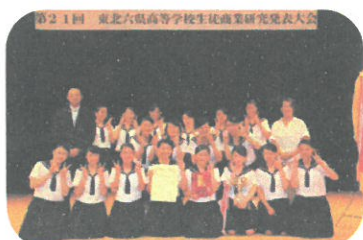
山形市立商業高等学校 産業調査部