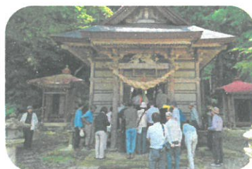
西川町歴史文化学習会