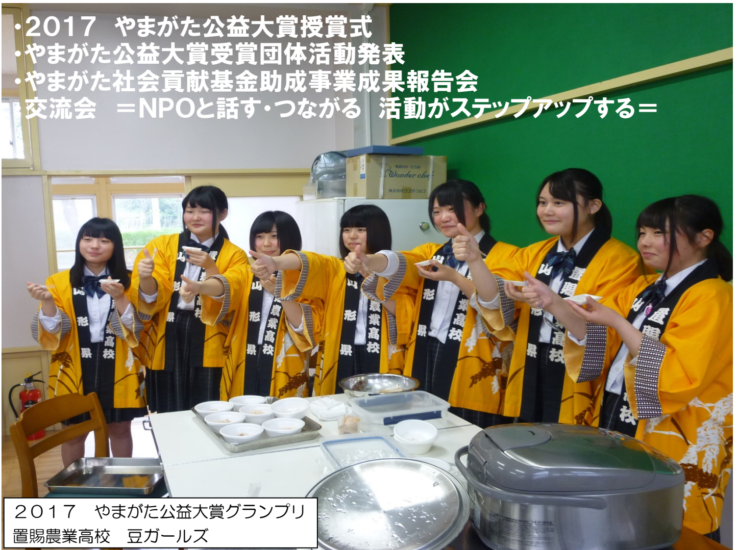
2017 やまがた公益大賞グランプリ 置賜農業高校 豆ガールズ