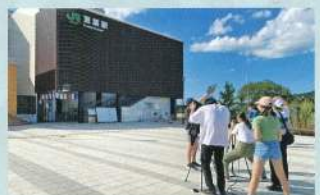
昨年実施した福島浜通りシネマプロジェクトの様子