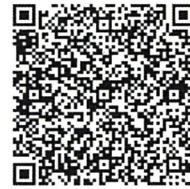
やまがたe申請（法人・団体）