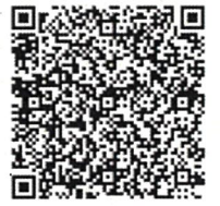
やまがたe申請（個人）