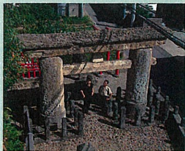
山形市内にある日本最古の石鳥居

《春の瀧山ハイキング》 本作の舞台となった霊場跡、瀧山神社等を巡ります 4/28 12:30スタート~15:30解散(小雨決行)