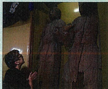
3メートルを超える巨大仏像