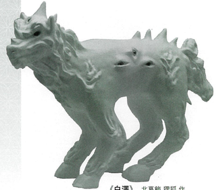
《白澤》 北葛飾 狸狐 作 平成24年(2012) 個人蔵