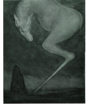
《變》 安井敏也 画 令和6年(2024) 個人蔵

このたびの展覧会では、江戸時代から現代に至るまで、妖怪や異界が絵画や文学などでどのように表現されてきたのかを見ていきます。妖怪が日本文化に与えた影響がいかなるものだったのか、また、その時代ごとの特徴がいかなるものだったかをご鑑賞ください。