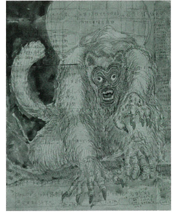
《飛驒の猿神》 金子富之 画 平成31年(2019) 個人蔵