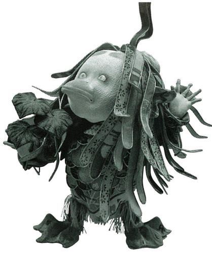
《アマビエ》 渡邊 渡作 令和5年(2023) 個人蔵