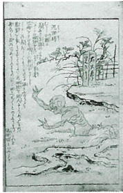
《今昔 百鬼拾遺》 鳥山石燕 画 安永10年(1781) 個人蔵