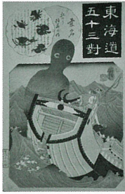
《東海道五十三對 桑名》 歌川国芳 画 江戸後期(19世紀) 個人蔵