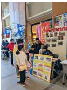
▲パトラン（檜山高校） の展示ブース

第18回の特徴は、大学生、専門学校生に加えて、高校生もボランティアに参加し、さらに檜山高校の生徒がパトランの活動紹介のために参加したことにより、若年層がより多く参加していたことでした。その一方で、各団体の話を積極的に聞いていたのは壮年期以上の方が多い印象を持ちました。一般的に若者には社会問題を身近に感じる機会が少ないため、社会参画への意識が醸成されにくいからだと考えられます。市民活動まつりに関わる若者が同世代の人々に対し社会問題や市民活動団体への興味を促すことができれば、活動団体の維持に貢献できるかもしれません。