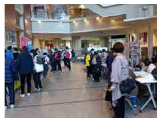
▲様々な分野で活動する団体が、 展示ブースで活動内容の紹介を 行いました。

参加団体に話をお聞きし、社会には想像以上に様々な課題があり、その解決または改善を目的とする団体があることを知りました。団体の存在を普段意識する機会は少ないかもしれませんが、将来的に誰もが関わりうる事柄を取り扱っています。しかし、その団体の方達の高齢化が進み、新しい世代への交代に課題を感じている方も多いです。各団体の存在とその活動目的を知ることは、団体の維持のためだけでなく一般の方にも大きな利益があります。そして一般の方が団体のことを知るために、「市民活動まつり」の役割は大きくなると思いました。