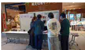
▲センターの展示ブースで 説明を聞くボランティア