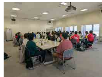
▲閉会后、参加団体とボランティア の皆さんで交流会を行いました

今回は、活動を拡大するために行政のサポートを必要とする団体や、支援の対象者にうまくアプローチできない団体が存在することが取材を通してわかりました。特に後者のような団体が存在するのは、要支援者が声を上げるのに消極的であること、また、要支援者に支援団体の存在が届いていないことも考えられます。今後支援の輪をさらに広げるためには、市民活動まつりの宣伝を含めた発信力の強化と一般市民の社会参画への意識づけが必要であり、それには活動団体と行政、学校など様々な機関との連携が重要になると感じました。