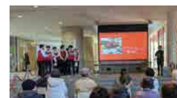
▲ステージ発表の様子