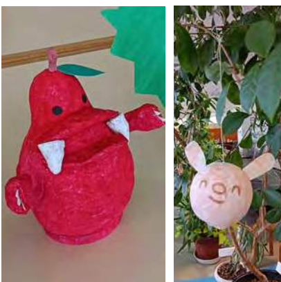
▲着々とパーティの準備が進行中です。ご期待ください！