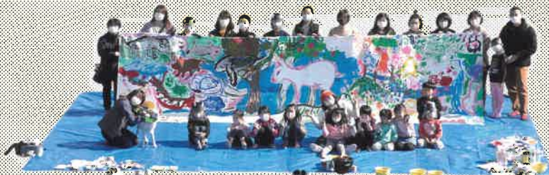
完成した作品と一緒に、ハイチーズ! (昨年度の様子)

完成した作品は、10月12日(火)～11月7日(日)まで、まなびあテラス エントランスホールにて展示します。