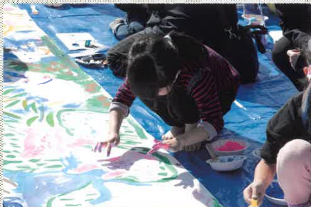
筆で、手で、足で、全身を使って大きな画面に挑戦! (昨年度の様子)