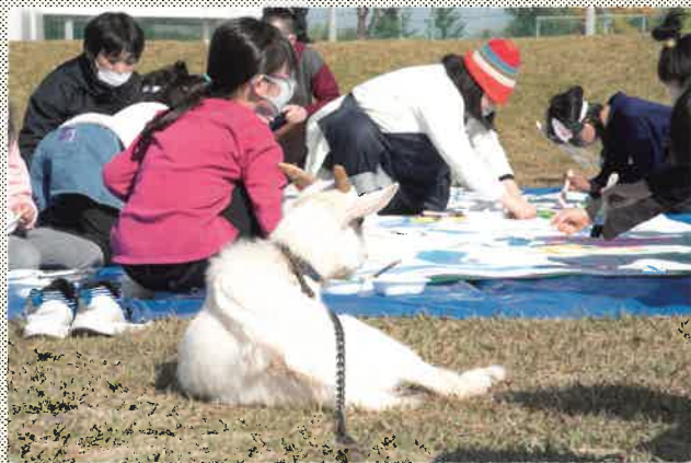
どんな「ボク」を描いてくれているのかな? (昨年度の様子)