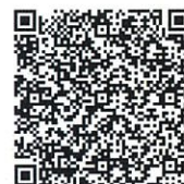
やまがたe申請 (個人)