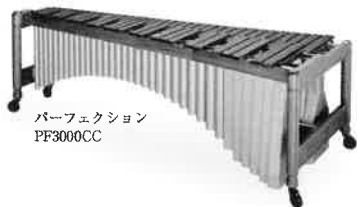
パーフェクション PF3000CC